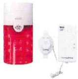
音・衝撃センサーピカフラッシュチャイムセット リーベックス株式会社