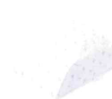
ロンボ RM6-H 防水カバーセット 株式会社ケーブ