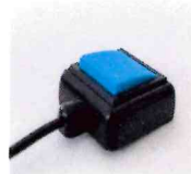
フィンガースイッチ アクセスニール株式会社