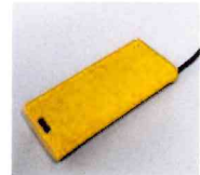
ロングスイッチ アクセスニール株式会社