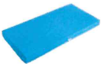
メディマット医療用フルサイズ BF918T テックワン株式会社