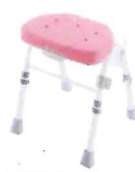
折りたたみシャワーチェア M型 背無し 株式会社リッチェル