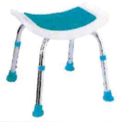
シャワーチェア楽湯STS 背無し 株式会社島製作所