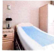
プレベティブシート 有限会社ホームケア選勝社