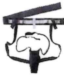
ユリナー専用ガーター DUR 102 新日産薬株式会社