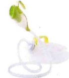
男性用採尿器 手持ちユリナー 新日産薬株式会社