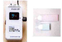
エアースイッチAS2 & シリコンチューブセンサ 有限会社オフィス結アジア