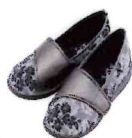
SaiSai W940 フラワープリント 株式会社マリアンス製靴