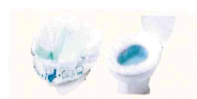
ワンズケアトイレ処理袋 介護・防災兼用 株式会社総合サービス