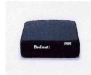
メディマツ アジャストクッション テックワン株式会社