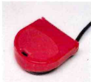
ハーフスイッチ アクセスニール株式会社