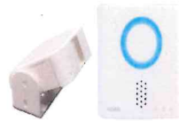
防雨型人感センサー人感チャイム リーベックス株式会社