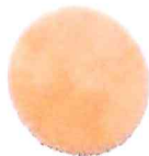
ナーシングラッグ NR-24 円座薄型穴無 株式会社ワイス