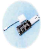
スイッチ接続キット(変わる君+USB2BT Plus) 有限会社オフィス結アジア