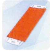
のせかえくんスライド タカノ株式会社