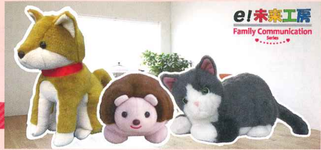
ぬいぐるみは日本製。ねこ型モデルを2019年秋発売予定

つい忘れがちな動作をご家族に代わってお知らせ。 高齢者の自立を支援する会話型ロボット。