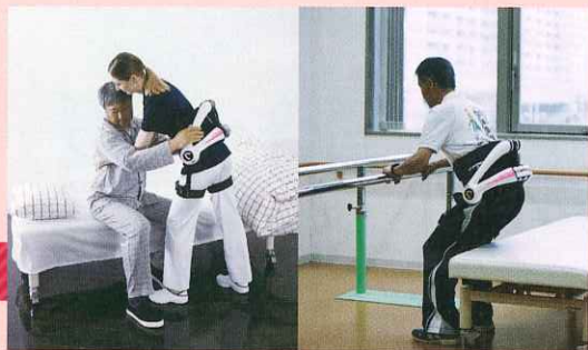
介護する側の使用